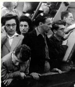
הסוכנות היהודית היא ארגון יהודי עולמי שהוקם ב-1929 על-ידי ד"ר חיים וייצמן, ומטרתו חיזוק העם היהודי ומרכזו בארץ ישראל.