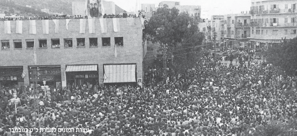
ניצרת המונים למחרת כ"ט בנובמבר