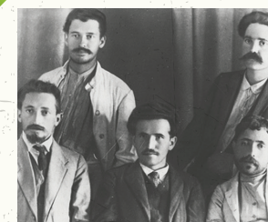
הוועד הלאומי - הגוף המבצע העליון של היישוב היהודי בארץ ישראל בתקופת המנדט.