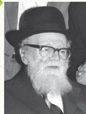
הרב שאול ישראלי

ממנהיגי הציונות הדתית בשנותיה הראשונות של המדינה, דיין וחבר במועצת הרבנות הראשית. תלמידו המובהק של הרב קוק. עמד בראש ישיבת מרכז הרב לאחר מותו של הרב צבי יהודה קוק.