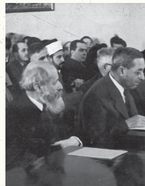
בובר משמאל, מעיד לפני ועדת החקירה האנגלו-אמריקאית, ירושלים 1946

הוגה דעות וחוקר, ממייסדי האוניברסיטה העברית וממייסדי ברית שלום אשר פעלה עוד בראשית המאה העשרים לדו-קיום בין יהודים לערבים בארץ ישראל.