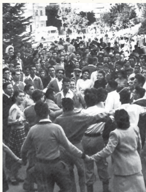
ריקודים עם היוזע דבר קבלת ההחלטה

ראש הממשלה השישי של מדינת ישראל. הוביל את המאבק בבריטים כמפקד הארגון הצבאי הלאומי (אצ"ל). לאחר קום המדינה היה ממייסדי תנועת החרות ונבחר מטעמה לכנסת.