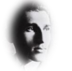
אברהם 'איר' שטרן (1880 – 1940) 'חיילים אלמונים' (1932)