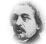
משה הס (1812 – 1875) 'רומי וירושלים' (1862)