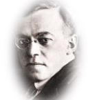
זאב ז'בוטינסקי (1880 – 1940) 'הציונות הרביזיוניסטית' (1926)