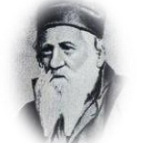
הרב יהודה אלקלעי (1878 – 1798) 'מנחת יהודה' (1840)