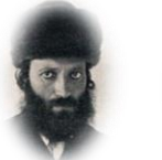
הראי"ה קוק (1865 – 1935) 'אורות' (1920)