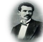
פרץ סמולנסקין (1840 – 1885) 'עם עולם' (1872)