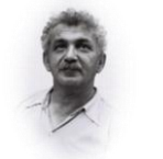
ברל כצלסון (1887 – 1944) 'לתנועת החלוץ' (1917)