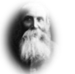
א"ד גורדון (1856 – 1922) 'לביור רעיונו מייסודו' (1920)