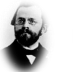
נחמן סירקין (1868 – 1924) 'שאלת היהודים ומדינת היהודים הסוציאליסטית' (1898)