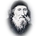
הרב צבי הירש קלישר (1875 – 1874) 'דרישת ציון' (1862)